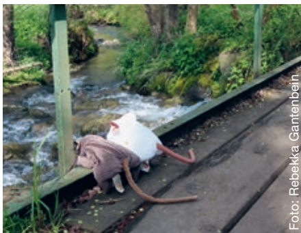
Hilda und Kuno am Fluss.

Auskunft und Anmeldung: Rebekka Gantenbein, 076 508 86 47, rebekka.gantenbein@reformiert-zuerich.ch oder auf www.pfefferstern.ch/ch/ZH/128