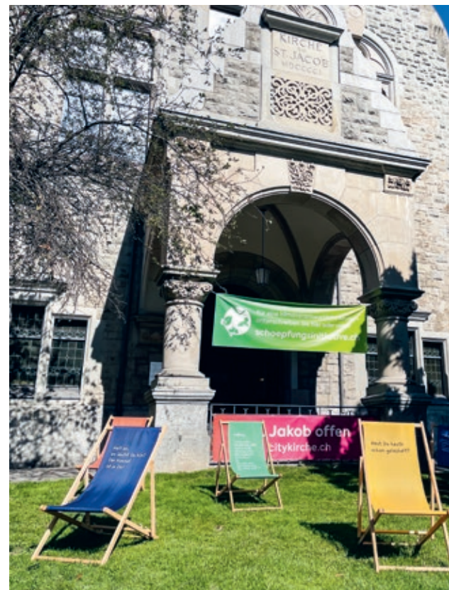
Heute ist die Kirche Heimat der Citykirche Offener St. Jakob, die bekannt ist für ihr soziales Engagement und ein breit gefächertes spirituelles Angebot.

ERIK BRÜHLMANN | Dieses Jahr wird im Kirchenkreis vier fünf gefeiert: Die Citykirche Offener St. Jakob wird 125 Jahre, das Pilgerzentrum Zürich 30 Jahre alt. Die beiden Jubiläen werden mit einer ungewöhnlichen und mutigen Aufführung begangen.