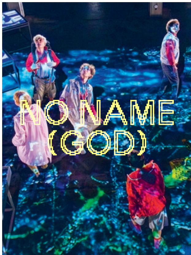
Zum Doppeljubiläum von Citykirche Offener St. Jakob und Pilgerzentrum wird eine Oper der besonderen Art aufgeführt.

Poster: Studio Noi